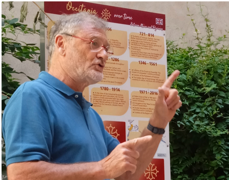
J'aurai tant aimé vivre ....( 2ème partie)

Par Dominique Drouet Président de Bolégadis