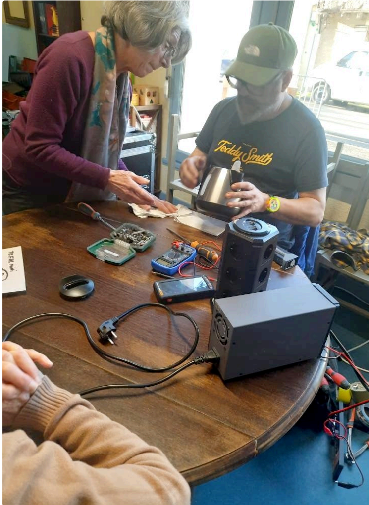
Ils vont gagner des centaines d'euros ce soir et vous aussi !

Au café associatif de la Guérite, ça va donner ! On va gagner des sous !