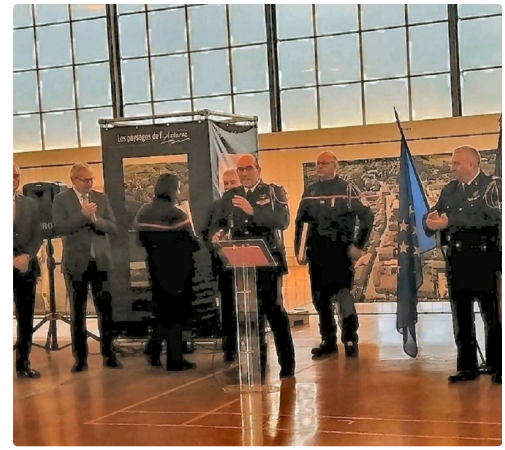
IMG_20250125_102800 (Copier) (Copier).jpg