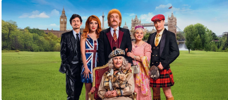
Au cinéma cette semaine, "God save the Tuche" en avant-première !