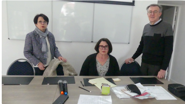
Comme un parfum d'Algérie à Condom