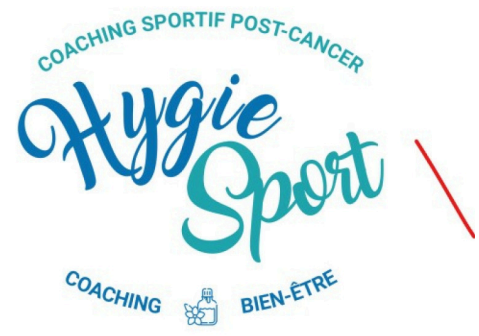
logo hygie sport.jpg