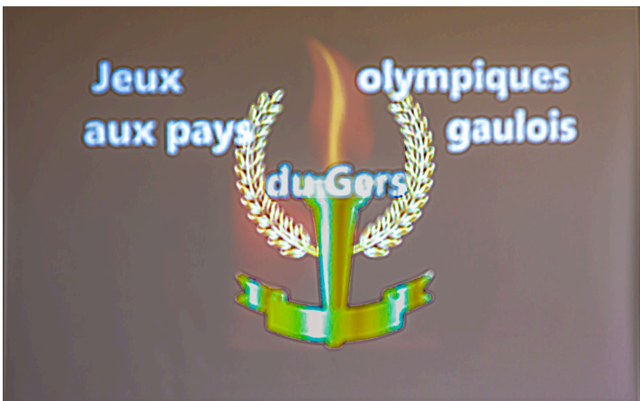
Logo des Jeux Olympiques du Bas-Armagnac

Un film résumant les épreuves est projeté à la suite de ces paroles. On y voit diverses épreuves : course d'obstacles, course en sac, course avec un enfant sur le dos et de nombreuses autres épreuves amusantes.