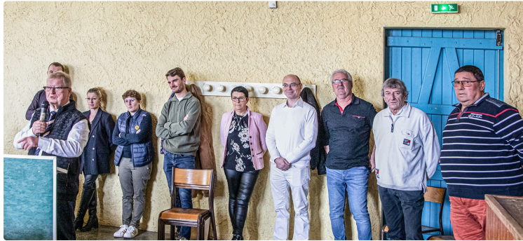
Toujouse : Jeux Olympiques du Bas-Armagnac avec Monguilhem et Perquie

Le maire présente ses vœux et la vie de la commune