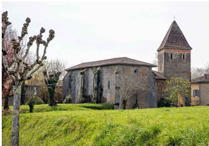
L'église de Toujouse