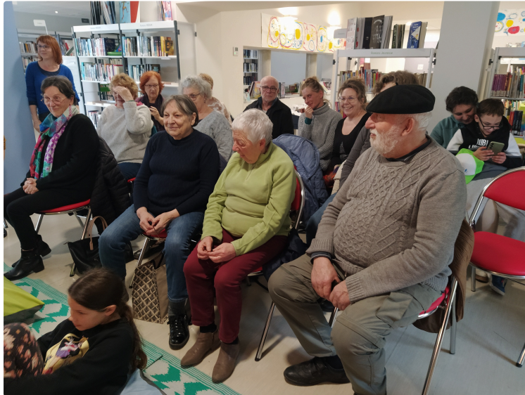
La Médiathèque a participé à la Nuit de la Lecture sur le thème des Patrimoines

Avec atelier d'écriture et après-midi avec une conteuse