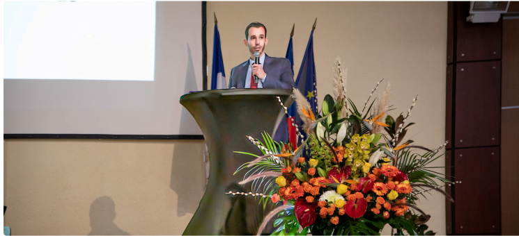
Éauze, forum des élus le 10.01.2025 : le plan France ruralités