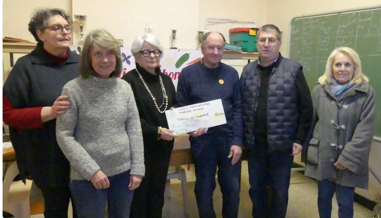
Un chèque bienvenu

Lundi dernier, l'association " Les jardins du bonheur " ont remis un chèque de participation à l' Association Française pour la Myopathie, AFM-Téléthon . Ce chèque représente le fruit de l'organisation d'un vide-greniers organisé par les jardins du bonheur.