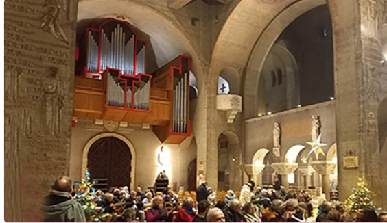
" La ruée vers l'Orgue ! "

De plaisance à Paris l'histoire d'une passion partagée