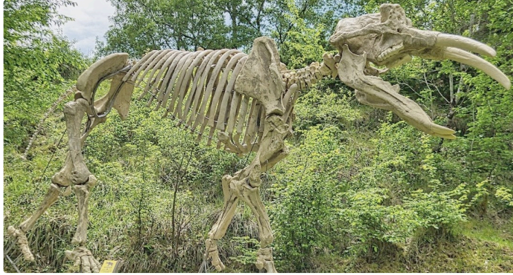
Création d'un centre d'interprétation pour le site paléontologique.

Un enjeu majeur pour la mise en valeur de l'un des sites paléontologiques les plus importants de France.