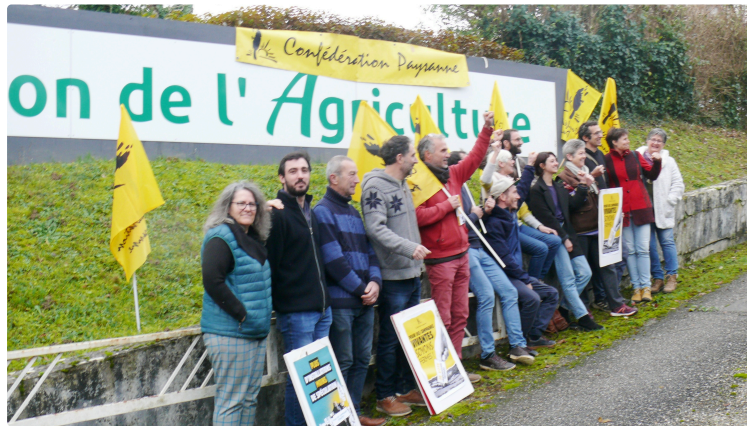
Élections de la Chambre d'agriculture : la Confédération paysanne lance sa campagne

Trois priorités sont mises en évidence : des prix rémunérateurs, la transition écologique, la défense de l'élevage paysan