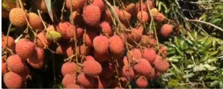
La cagnotte Leetchi dévoile son activité

Agriculteurs, personnel soignant et commerçants : le top 3 des professions les plus soutenues en 2024