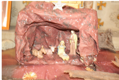
Creches eglise (5).JPG