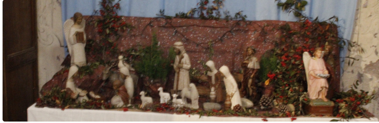
La ronde des crèches miélanaises

Il suffit de flâner dans les rues de Miélan, éventuellement muni d'un plan, pour découvrir la trentaine de crèches exposées à la vue de tous, dans une vitrine ou derrière la vitre d'un logement particulier.