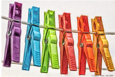
Conte de Noël : "Et si c'était vrai ?"

Comme vous le savez, notre photographe collaborateur, François Macé , a plus d'une corde à son arc. Ecrivain à ses heures, il nous a gratifiés à plusieurs reprises d'histoires sorties tout droit de son imagination prolifique.