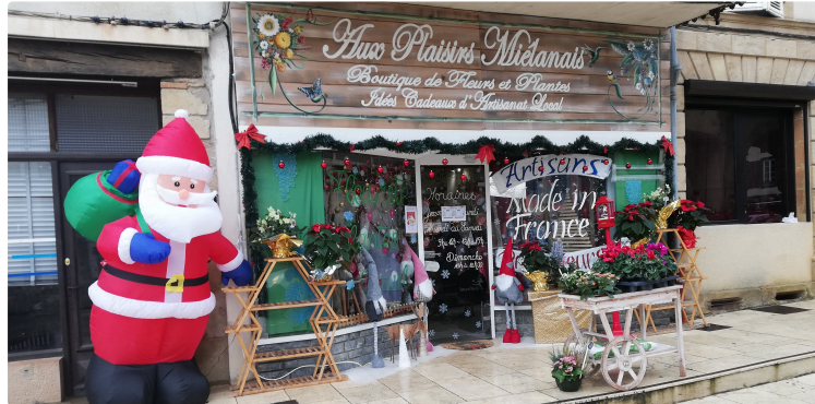
Le Petit futé a remarqué Aux Plaisirs miélanais

Idées de séjour, informations pratiques et culturelles, bonnes adresses, lisez, faites lire le Petit Futé Gers Gascogne 2025.