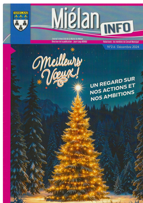
Miélan Info 2 6 Dec 2024.jpg

Enfin, un appel au recrutement de sapeurs-pompiers volontaires pour que le centre de secours et d'incendie de Miélan perdure et garantisse l'efficacité de ses interventions, occupe les deux dernières pages.