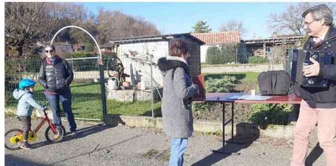
Animation sur le Marché de Pavie

C'est sur la petite place du marché, derrière la médiathèque, que la matinée a commencé à Pavie ce mercredi 18 décembre.