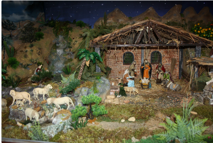
La féerie de Noël

Installés sur face au centre commercial de La Fontaine à Pavie , les deux chalets de l'association " Pour l'amour du monde " viennent apporter une touche féérique supplémentaire aux illuminations et animations de Noël de Pavie.