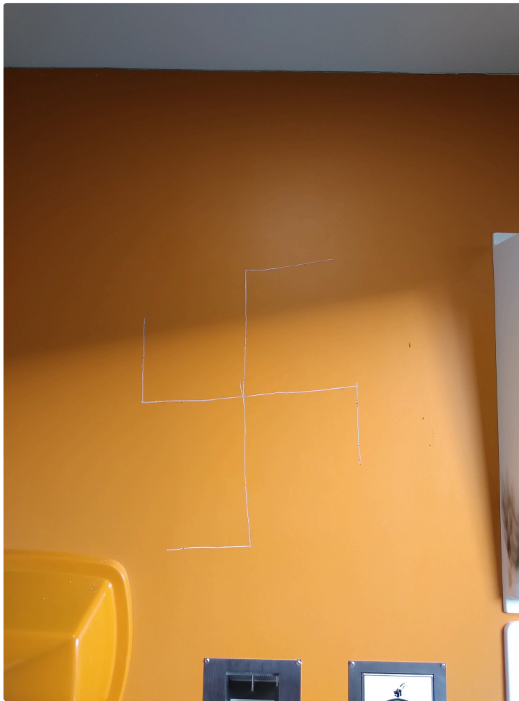
Dégradations intolérables dans les sanitaires publics de la Place Gambetta.