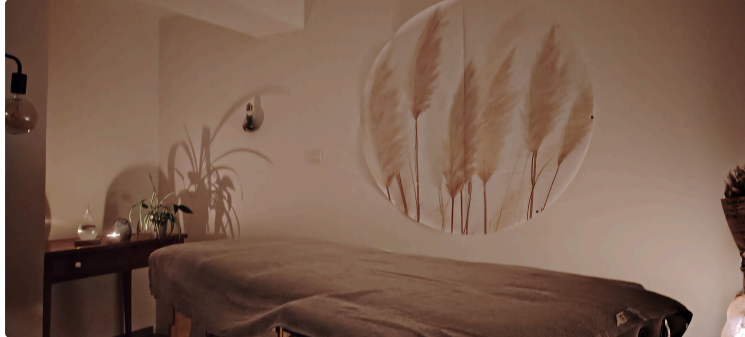
Nouveau à Vic : massages bien-être intuitifs et cours de pilates !

Nous vous avons récemment présenté le cabinet Vic Thérapies qui accueille 8 praticiennes du bien-être et de la santé.