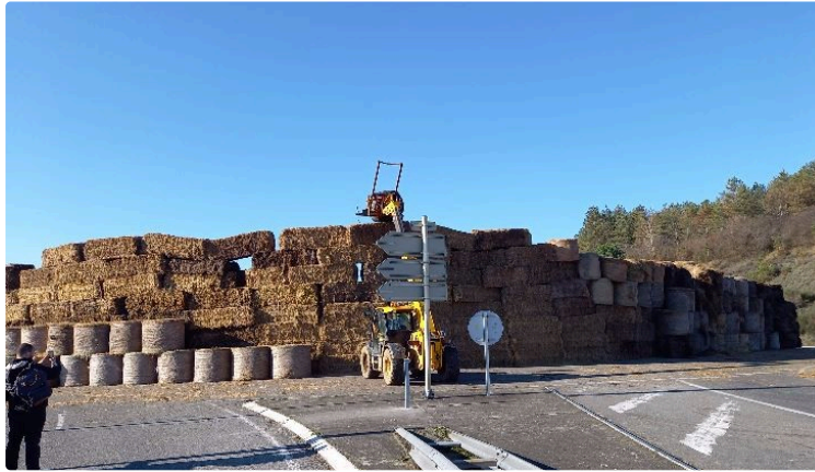
" Le mur des cons " est érigé par la Coordination rurale du Gers

Au rond-point de Saint-Cricq ce sont 579 bottes de paille et de foin mises en place pour bloquer la circulation vers Toulouse