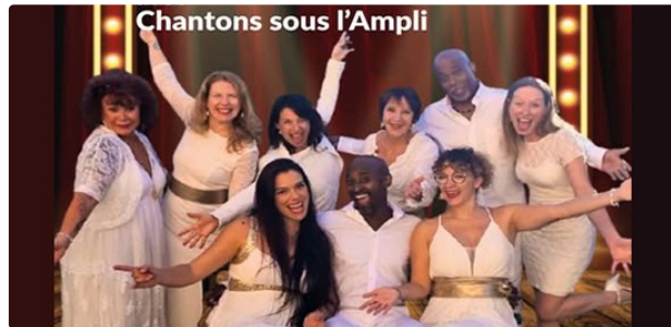
Du Gospel mais pas seulement

La température devrait monter de quelques degrés samedi dans l'église de Gimont !