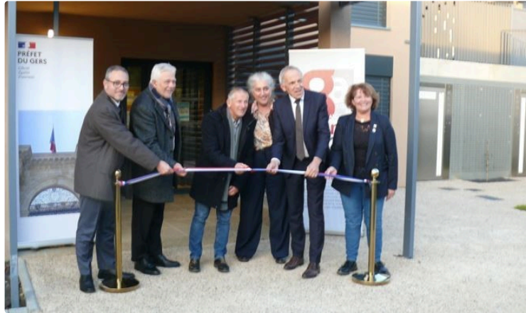
Auch Garros : inauguration d'une séduisante ludothèque

Dans la foulée de la cinquième revue de projet annuelle liée à la convention du Nouveau programme national de renouvellement urbain 2019-2026 qui s'est tenue à Auch jeudi 5 décembre a eu lieu en début de soirée l'inauguration de la ludothèque qui d'ailleurs a ouvert le 19 octobre dernier.