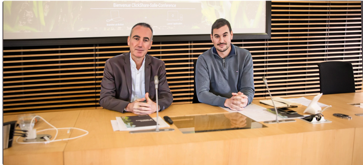
Risclé : Vivadour résilient malgré les aléas climatiques et géopolitiques