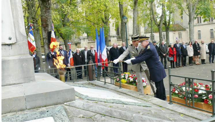
Hommage aux "Morts pour la France" pendant la guerre d'Algérie et pendant les combats du Maroc et de la Tunisie