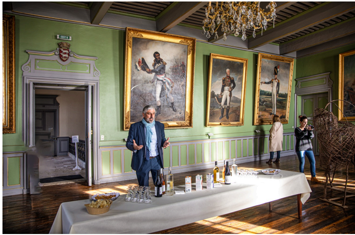
Le maire fait les honneurs des magnifiques salles de la mairie