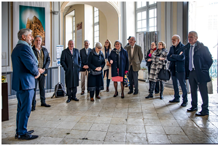
Le maire raconte Lecture à ses hôtes