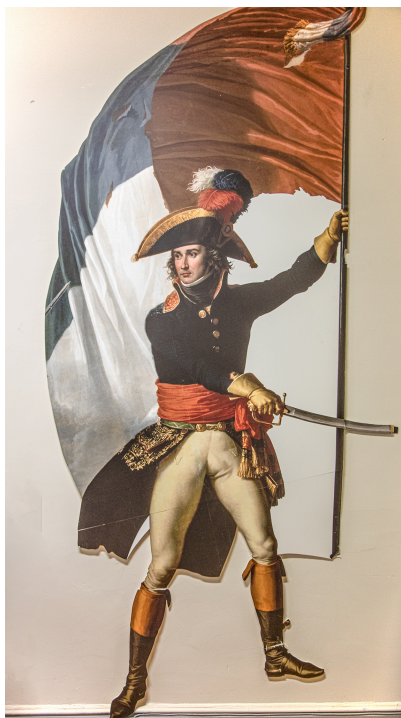
Portrait du maréchal Lannes