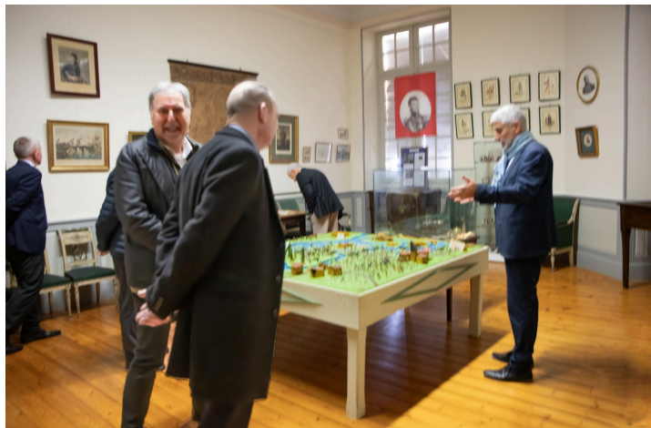
La maquette des batailles d'Essling et de Lőbau