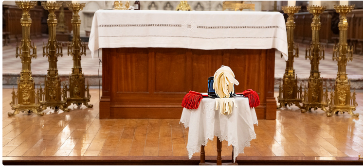
Les anciens Saint-Cyriens du Gers ont fêté Austerlitz à Lecture

Ils ont été reçus par le maire dans sa magnifique mairie