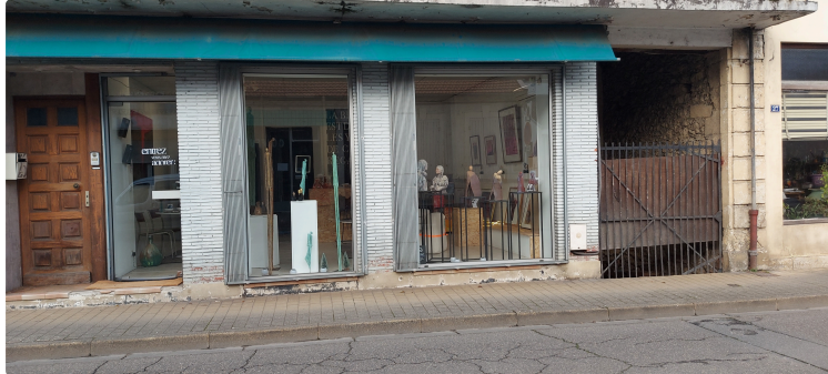
Nouveau à Vic : l'atelier de graphisme "La Ligne rouge"

Nous vous avons déjà rapidement présenté l'atelier " La Ligne rouge" installé au 30 rue de la République à propos de l'inauguration de l'exposition "Rouge Rouge" samedi 7 décembre : https://lejournaldugers.fr/article/80582-nouveau-a-vic-latelier-ligne-rouge-invite-les-artistes