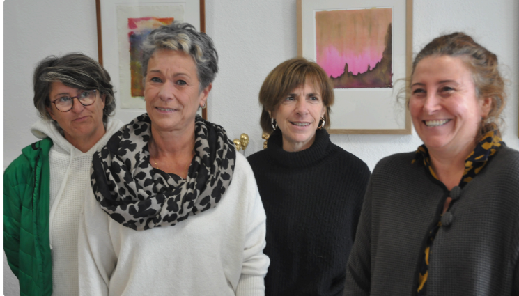
Nouveau à Vic : l'atelier « Ligne rouge » invite les artistes !