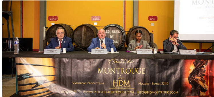
Nogaro : le coup de gueule du président des Hauts de Montrouge

Désorganisation du système d'assurance, frein aux prêts Agilor s'ajoutent à une 4e année catastrophique