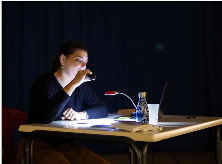
Pendant la conférence