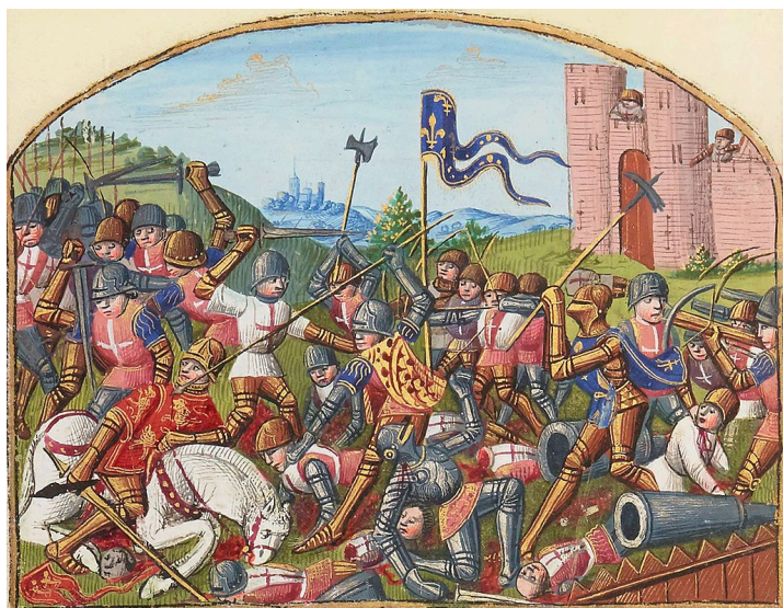
Mort de John Talbot

En 1453, l'armée anglaise, commandée par John Talbot (2) est écrasée à Castillon (actuellement Castillon-la-Bataille). C'est une bataille intéressante, car c'est la première fois que l'artillerie joue un rôle autre que celui d'arme de siège. L'armée anglaise dépourvue de son artillerie, qui était en retard, subit le feu des maîtres de l'artillerie, les frères Bureau.