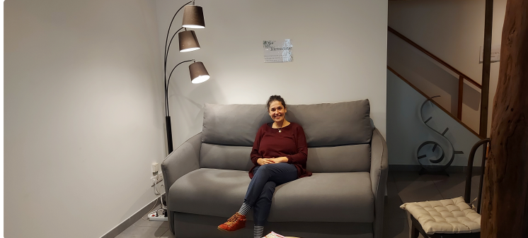
Le nouveau cabinet Vic Thérapies à la radio mercredi !

Le cabinet Vic Thérapies accueille au 30 rue Victor Hugo à Vic-Fezensac 8 praticiennes du bien-être et de la santé.