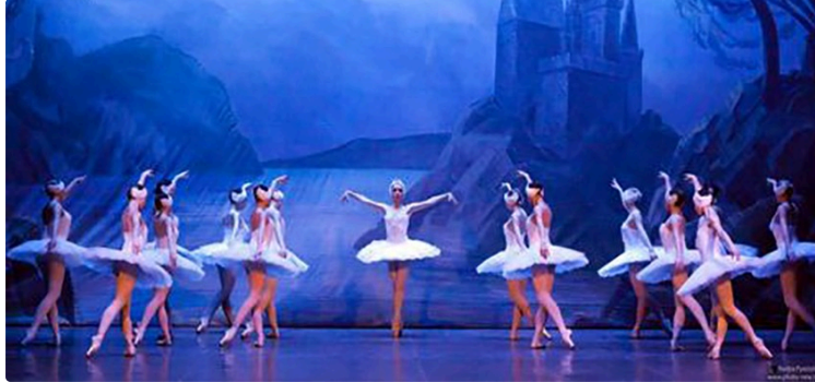
Le Lac des Cygnes : un évènement exceptionnel salle André Beaudran

les réservations ouvertes a compterdu 5 décembre