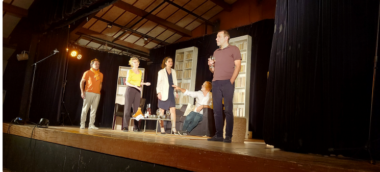
Un public nombreux totalement conquis par la pièce "Le prénom" !