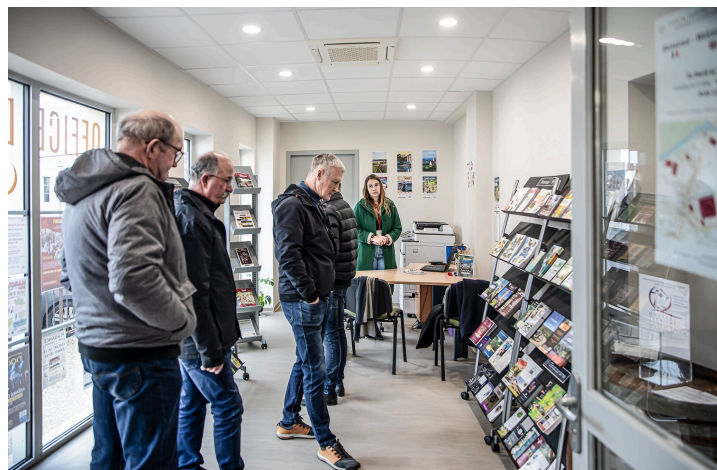
L'Office de tourisme