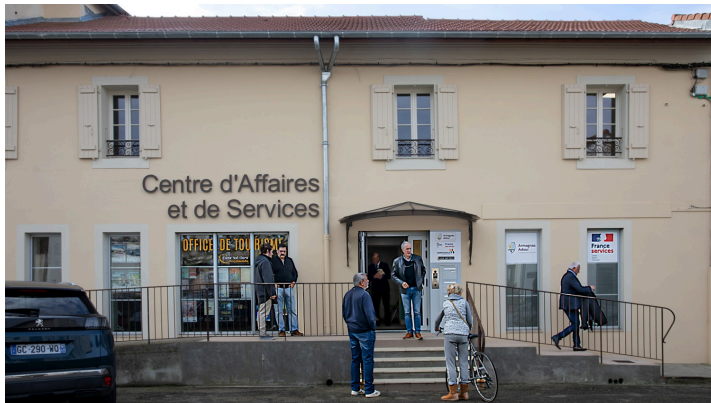
Vue de l'hôtel Caupenne, Centre d'affaires et de services