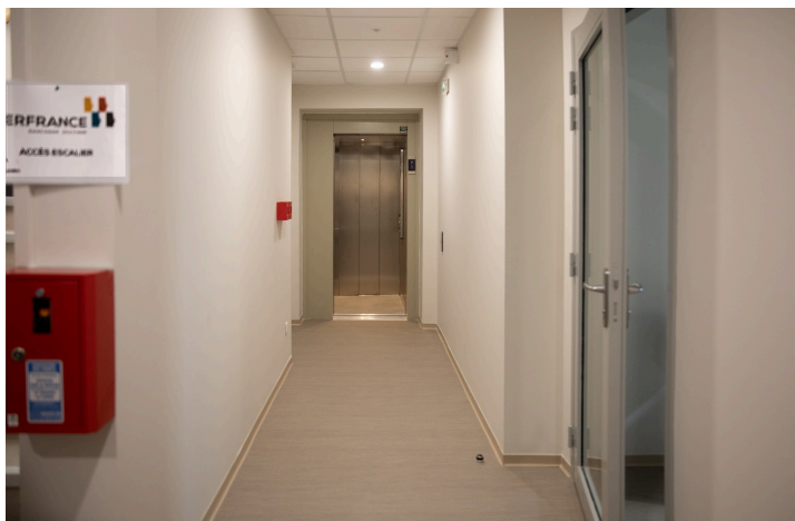
Mais il ya aussi un ascenseur...