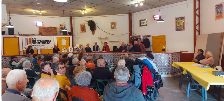
La Bienfaisance : une association historique toujours très active de 242 adhérents