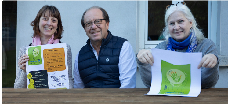
Urgent : inscription au Trophée Initiatives RSE en Armagnac

Pour mettre en valeur une de vos réussites