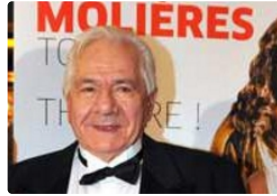
Décès de Michel Galabru

La disparition inattendue de l'acteur célèbre pour ses rôles dans Uranus, Le Gendarme, Le Viager ou encore Le Bon Roi Dagobert a déclenché une importante vague d'émotion en France et dans le reste du monde. Acteur incontournable de la Comédie française, Michel Galabru s'est éteint lundi dans son sommeil, à l'âge de 93 ans.