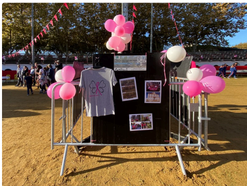
IMG_9241 IJdG Kopie.jpg

Sans oublier un grand merci à tous les bénévoles de GYM PLUS et à tous les participants à cette journée.