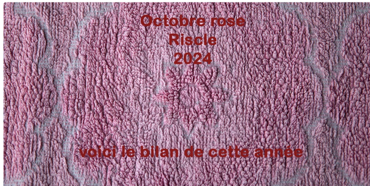
Octobre Rose à Riscle, bilan de cette année