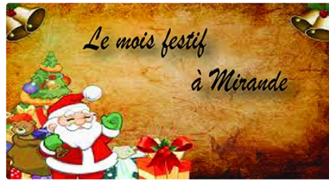
Coup d'envoi des festivités de fin d'année