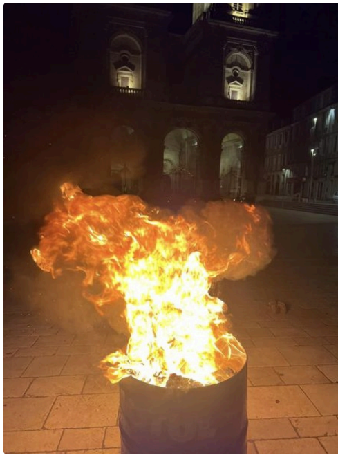
FEU DE LA COLERE.jpg