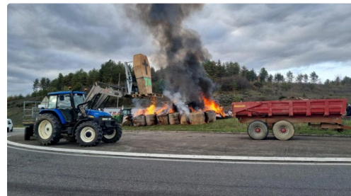
ROD POINT DE SAINT-CRICQ.jpg