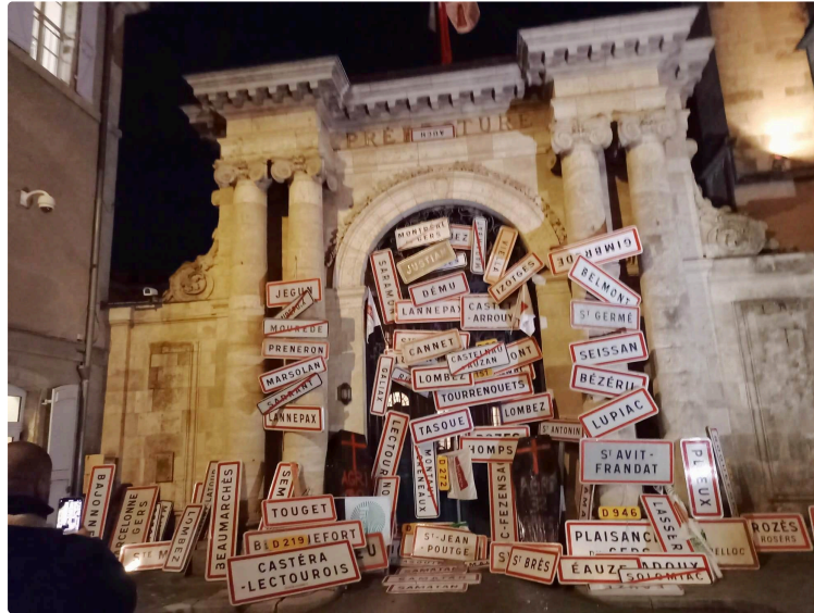
JA32 et FDSEA32, les feux de la colère

Les Jeunes agriculteurs du Gers et la FDSEA 32 se sont mobilisés ce lundi après-midi 18 novembre à Auch « pour faire entendre leur détresse, pour rétablir une agriculture plus juste et plus sereine pour la ferme Gers et s'ériger contre un possible accord entre UE/Mercosur ». C'est donc avec une cinquantaine de tracteurs qu'ils manifestèrent sur le rond-point des Justes, le rond point de Saint-Cricq, le rond point de Pavie, le rond point de la Patte-d'Oie avant de se retrouver place de la cathédrale à Auch et devant la préfecture.