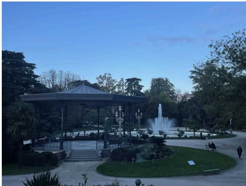
Le Grand Rond

Aujourd'hui, sa verdure constitue un espace vert apprécié des Toulousains, qui viennent s'y promener, pique-niquer, ou simplement profiter de la tranquillité du cadre.