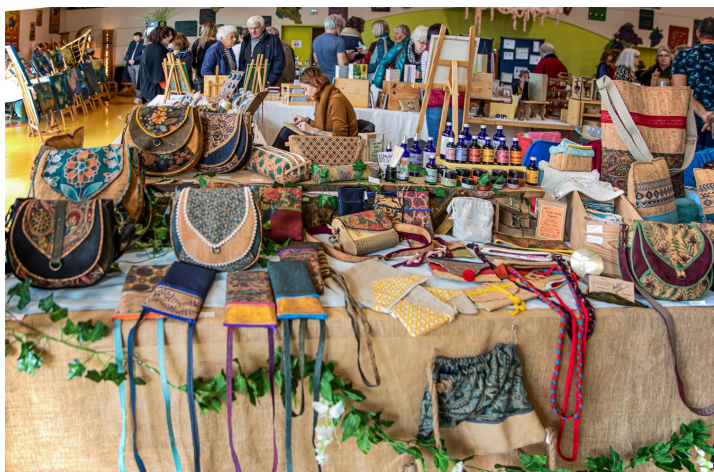
Sacs et sacoches