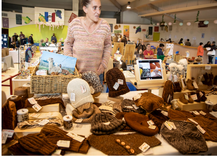
Bonnets et gants de laine