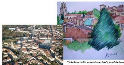
"Où le fleuve du Ras entrecroise ses bras" (Jean de la Gessède)

Le Protestantisme en fait au XVIème siècle une de ses "places de sûreté", dans des guerres fratricides. Après la Révolution, c'est un chef-lieu de canton rural, où la République mettra longtemps à s'imposer. Notre XXème siècle enfin sera celui des deux guerres mondiales, la "saignée" de la première, l'occupation et la Résistance de la seconde. Depuis 1950, la "révolution silencieuse" bouleverse ses campagnes et son bourg-centre. De nombreux encarts pour faire vivre notre histoire par ses témoins.