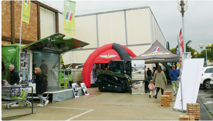
Le forum des métiers de l'uniforme a séduit et rempli sa mission auprès du public

Plus d'une vingtaine de 20 unités de tout horizon étaient présentes au centre commercial de Leclerc à Auch