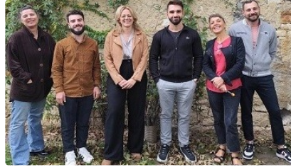
Des nouvelles de "La Fabrique des Colibris" et le "Comptoir des Colibris"

Une exposition à chaque restaurant du même artiste bonne idée non ?