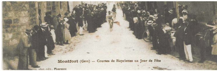
Société archéologique du Gers, communications de novembre 2024