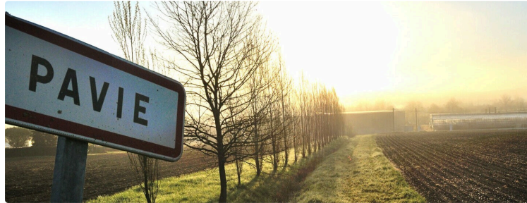
Avec envie nous irons à Pavie

Nous irons promener Mardi prochain 12 novembre 2024.