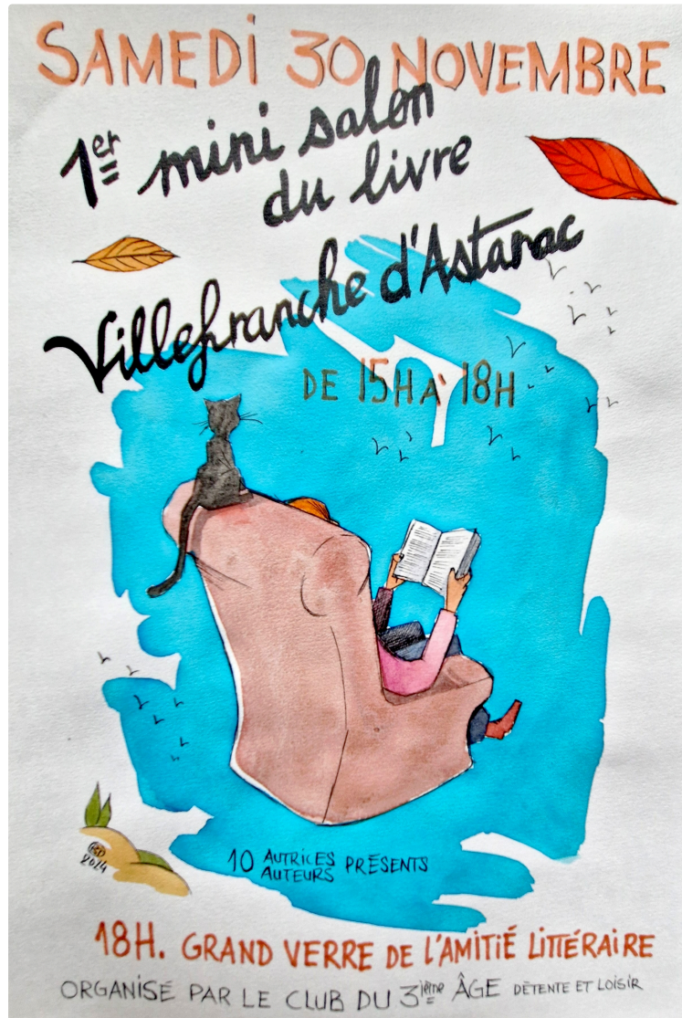
Mini salon du livre d'auteurs locaux à Villefranche-d'Astarac

Samedi 30 novembre de 15 h à 18 h dans la salle culturelle du Préau , le premier mini salon du livre d'auteurs locaux à Villefranche-d'Astarac réunira 10 écrivains, sous l'égide du club du 3e âge Détente et Loisirs . Cette aventure inédite offrira une belle palette de découvertes. Terroir, romans, poésie, ouvrages scientifiques. Un après-midi culturel et chaleureux, hors les écrans, qui se terminera par le grand verre de l'amitié littéraire.